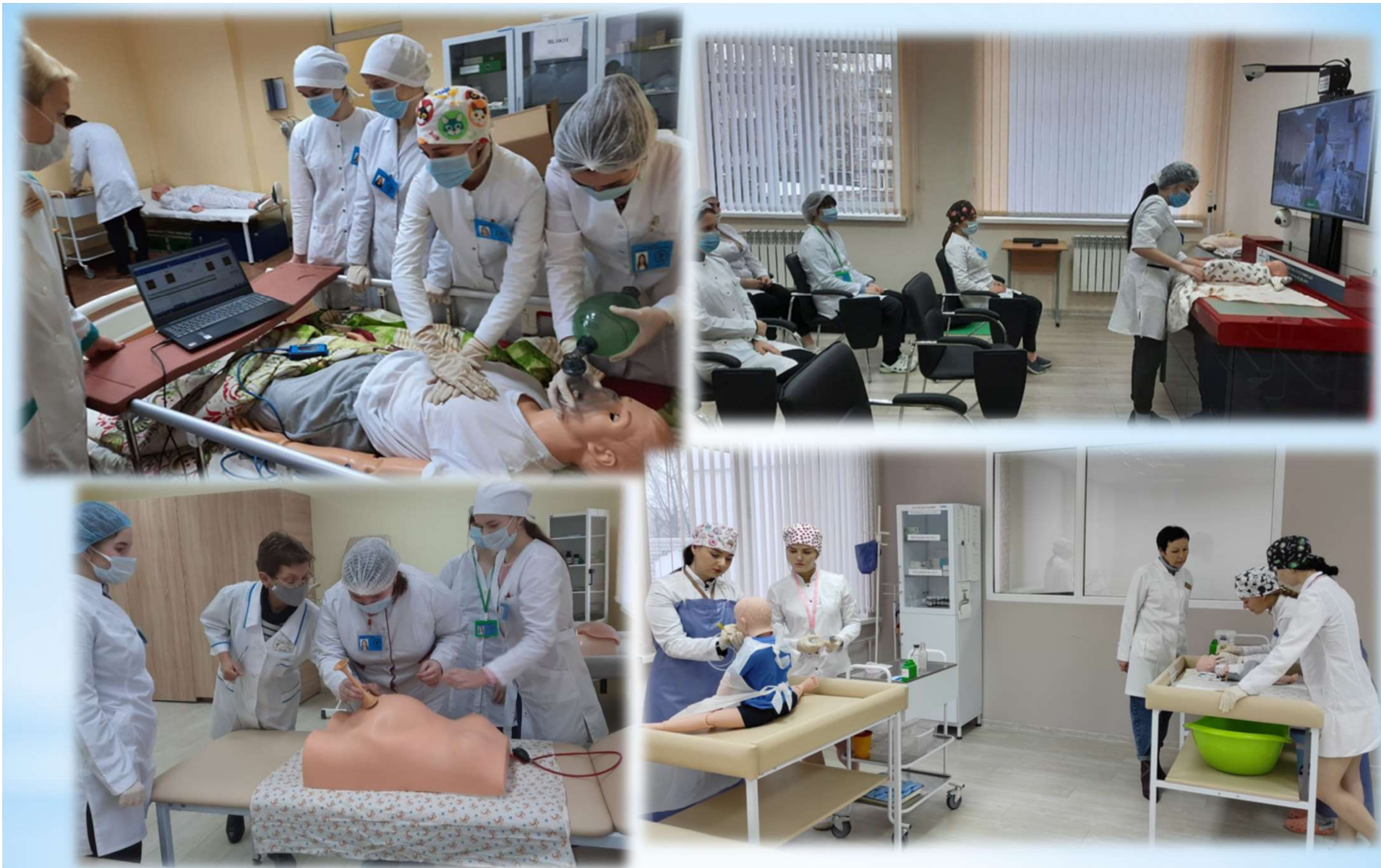
Фельдшер-акушер. Помощник врача