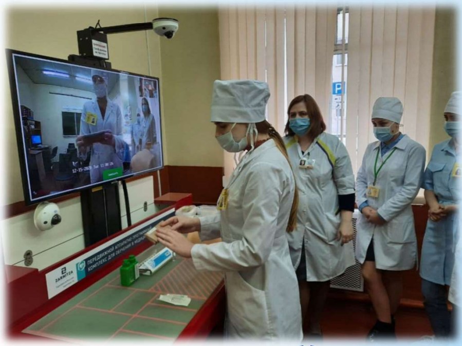
Медицинская сестра (медицинский брат)